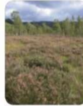
tourbière à Passonfontaine (25)

Les tourbières, des milieux naturels en danger ! La tourbe provient des tourbières, un milieu naturel qui a mis des milliers d'années à se constituer... C'est donc une ressource naturelle rare, alors privilégiez des terreaux sans tourbe.