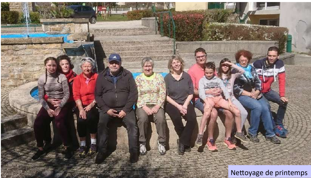
Nettoyage de printemps