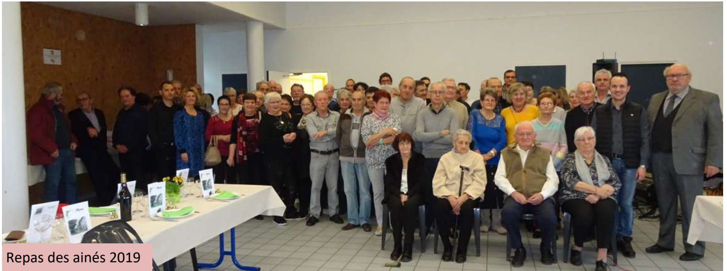
Repas des aînés 2019