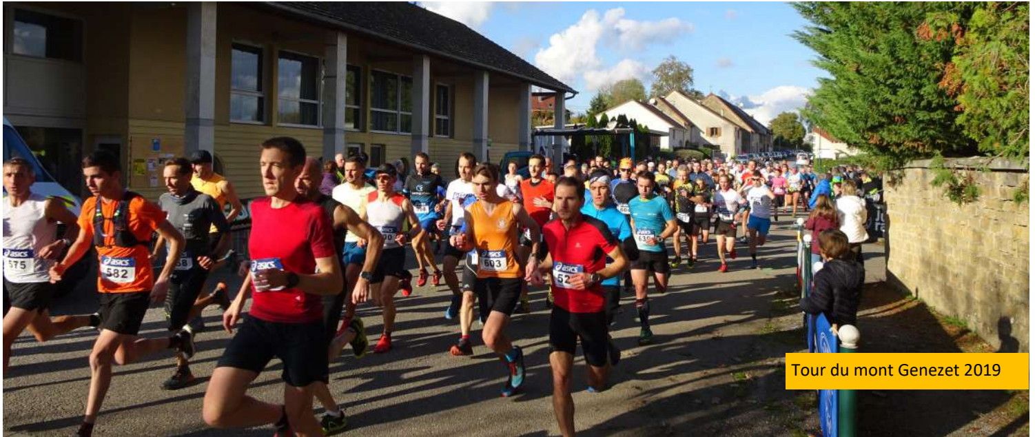
Tour du mont Genezet 2019