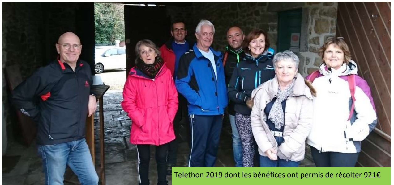
Telethon 2019 dont les bénéfices ont permis de récolter 921€